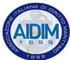
Tavola Rotonda L'incaglio della nave Ever Given nel Canale di Suez e Assemblea sociale

Yacht Club Adriaco, Molo Sartorio 1 Mercoledì 8 settembre 2021, ore 18.00